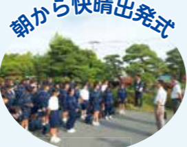
朝から快晴出発式