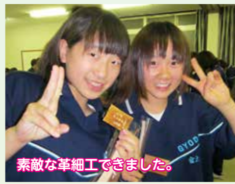
素敵な革細工できました。

天候にはあまり恵まれたと言えませんが、白樺湖畔を巡るウォーラリー、車山周辺のハイキングを中心として、自然の中で過ごした三日間は、子ども達にとって大きな成長と、かけがえのない思い出をもたらしてくれたものと喜んでいきます。