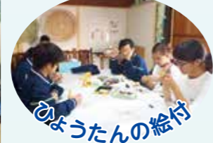
ひょうたんの絵付け