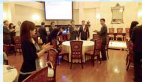
5月8日に和やかに歓送迎会が行われました