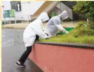
～200名を超える皆さんによる作業の様子～