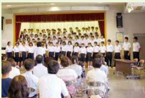
行中音楽部による混声合唱の披露

日本動脈硬化学会の報告 子供たちの肥満や生活習慣病の背景には自らの心や体を大切にする「自尊心の欠如」が関わっている。 子どもだけでは... 肥満度の高い生徒では、例えばテレビ視聴やゲームに費やす時間が長い傾向がみられたが、