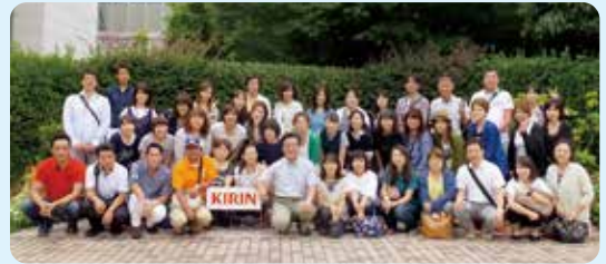
秋晴れの中、総勢44名 横浜を満喫しました。