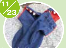
生活科学部デザインのデニムの足袋