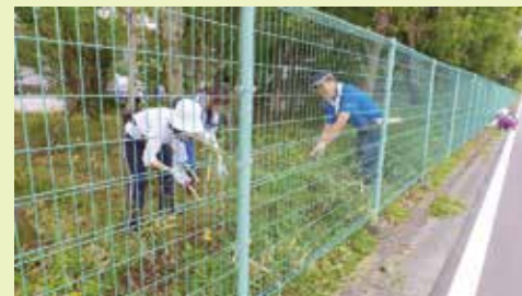
今年度最後の除草作業