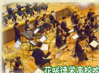
花咲徳栄高校吹奏楽部による演奏