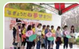
生徒・先生・保護者9名の「チーム行中」