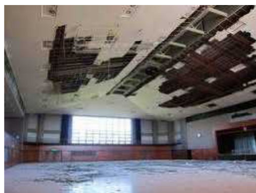
震災により崩れた学校の天井板

工事終了予定は2月1日です。その間、体育館を使用する諸行事等は以下のように行います。部活動については、行田特別支援学校、下忍小学校、南小学校様のご厚意により、各体育館をお借りしました。