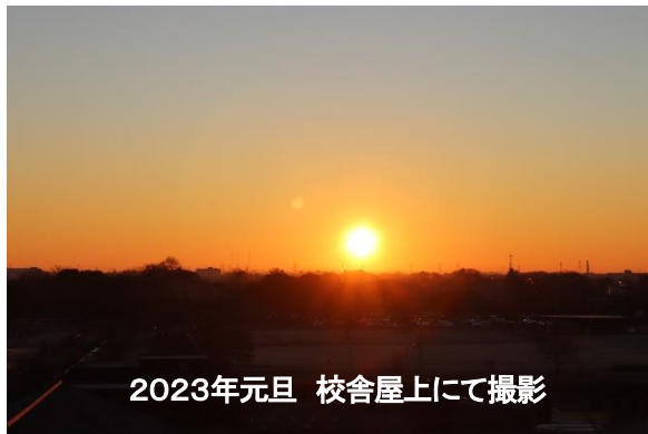
2023年元旦 校舎屋上にて撮影

相田みつを なんでもいからさ 本気でやっでごらん 本気でやれば たのしいから 本気でやれば つかれないから つかれても つかれが さわやかだから