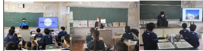
【さいたま水族館】 【老本幼稚園】 【大野建設】