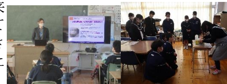
【近畿日本ツーリスト】 【行田市立図書館】

本校のキャリア教育の一環として、1年生が「働く人々に学ぶ会」を実施しました。それぞれの方面で働く方々5名を講師として招き、仕事についてお話いただきました。実際に働いている方の生の声は、説得力があり、生徒たちも集中して聞き入っていました。将来の仕事について考える大きなきっかけになったと思います。