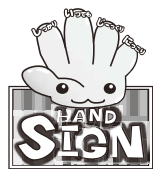
道路横断時の安全行動イメージキャラクター「サイン(SIGN)ちゃん」