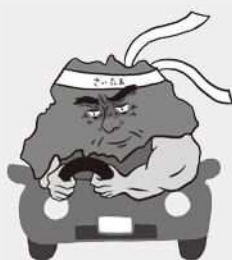
歩行者優先イメージキャラクター「さいたまお父さん」